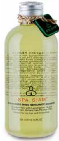
HAIR Lemongrass Shiso Bergamot Shampoo