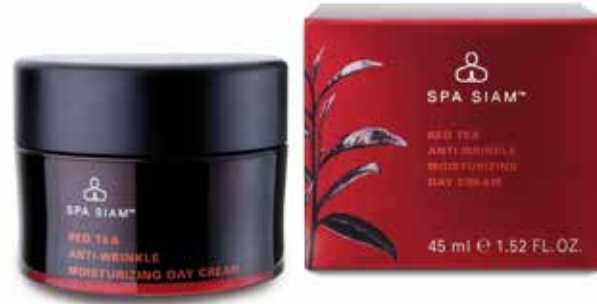
FACE Red Tea Anti Wrinkle Moisturizing Day Cream