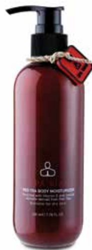
BODY Red Tea Body Moisturizer