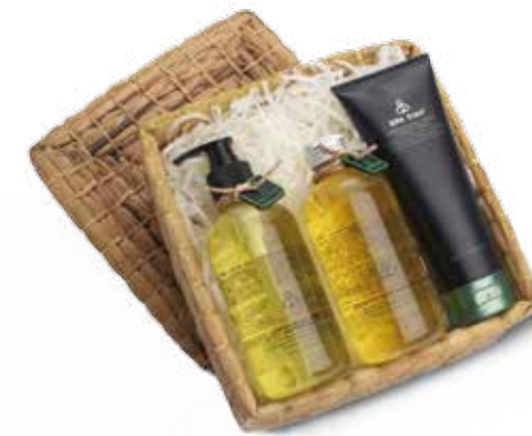
Lemongrass Water Hyacinth Bath Body Set SET