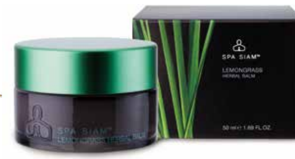
Lemongrass Herbal Balm BODY