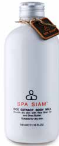
BODY Rice Extract Body Milk