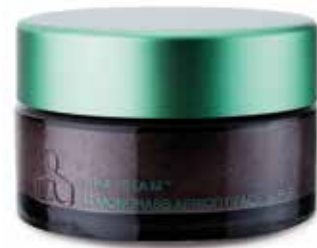
FACE Lemongrass Apricot Face Scrub