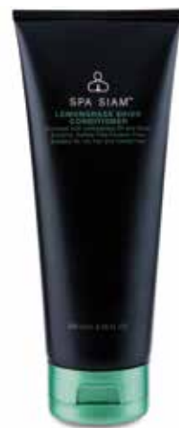
HAIR Lemongrass Shiso Conditioner