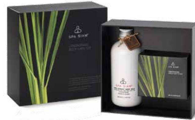
Lemongrass Body Care Set SET