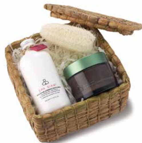
SET Lemongrass Water Hyacinth Exfoliating Set