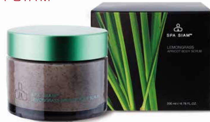
Lemongrass Apricot Body Scrub BODY