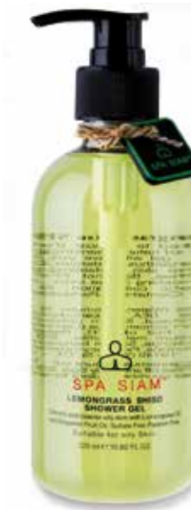
Lemongrass Shiso Shower Gel BODY