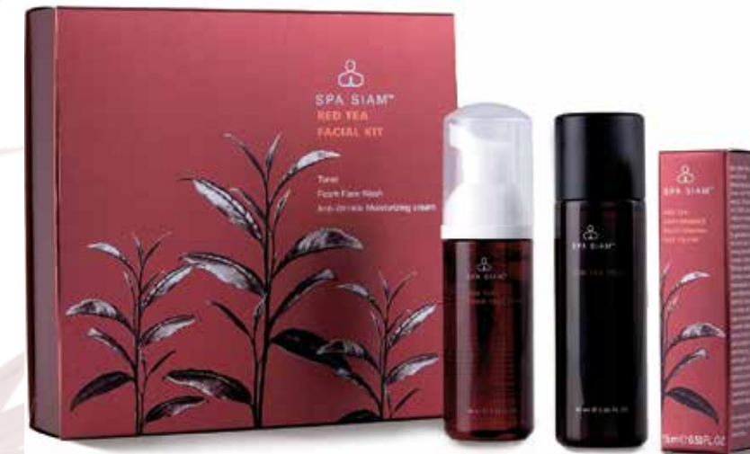
SET Red Tea Facial Kit