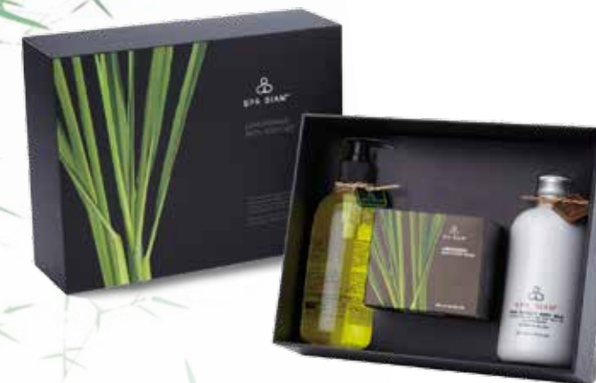
Lemongrass Bath Body Set SET