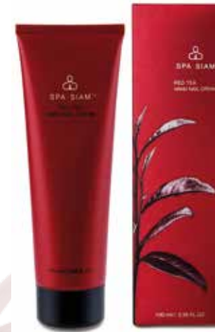
BODY Red Tea Hand Nail Cream