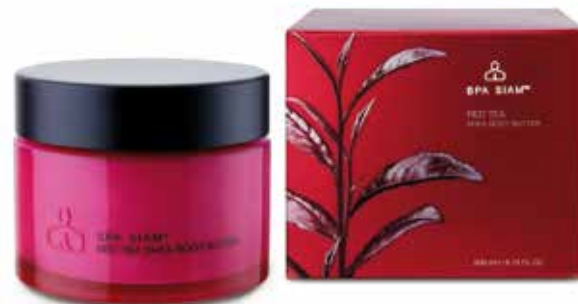
BODY Red Tea Shea Body Butter