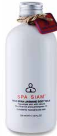
BODY Rice Bran Jasmine Body Milk